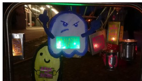
Laternen am Startpunkt der Demo