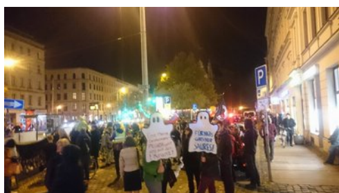
Zwischenkundgebung auf dem Südplatz